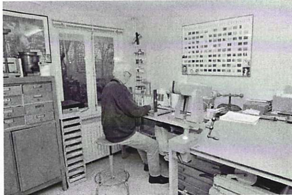
Atelier van de handboekbinder